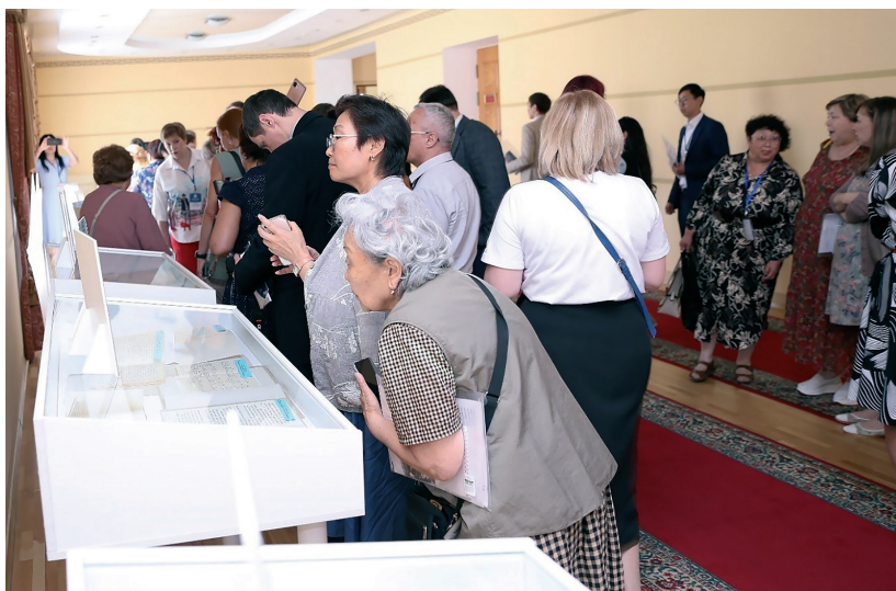
Презентация выставки фондов личного происхождения Государственного архива РБ Архивы. Документы. Люди: фонды личного происхождения как исторический источник г. Улан-Удэ, 21 июня 2023 г.