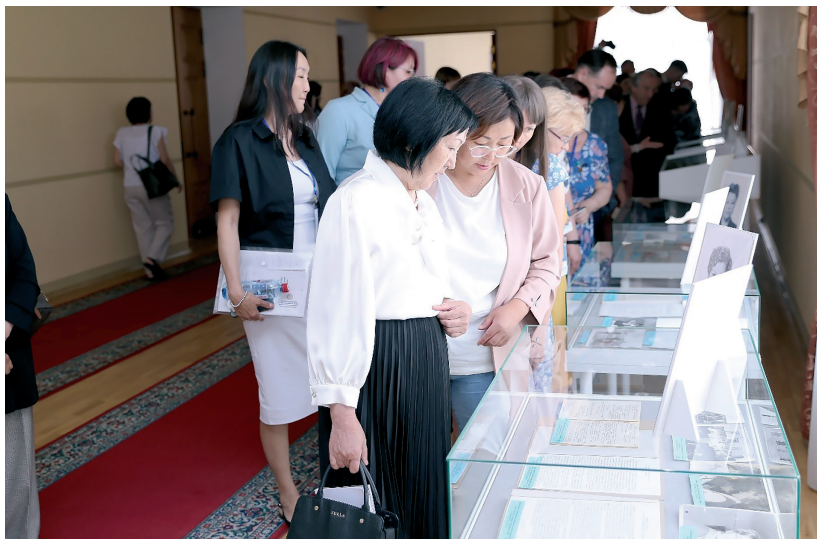
Презентация выставки фондов личного происхождения Государственного архива РБ Архивы. Документы. Люди: фонды личного происхождения как исторический источник г. Улан-Удэ, 21 июня 2023 г.