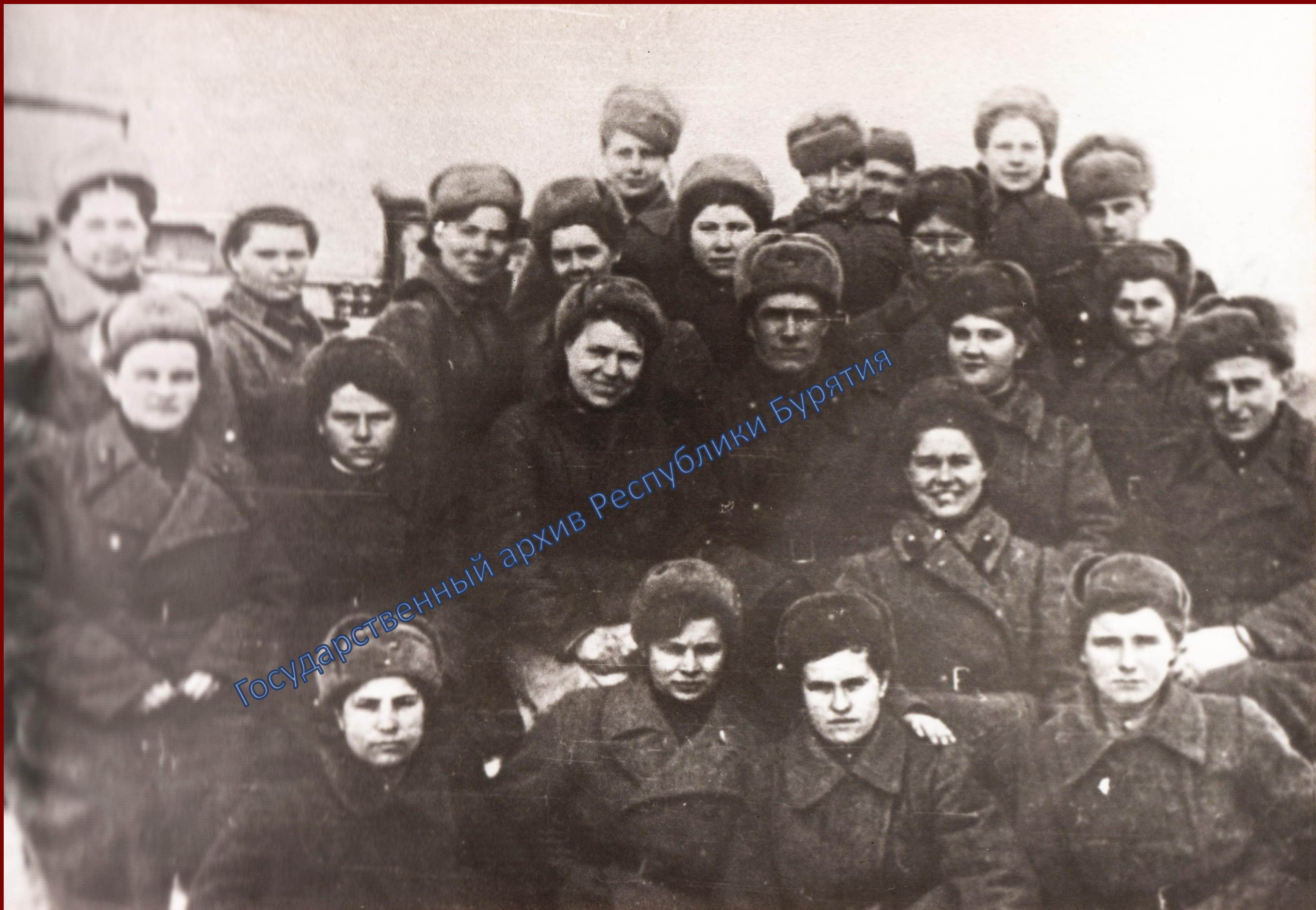
Женщины-воины 82-й гвардейской стрелковой дивизии после получения правительственных наград. Июнь 1944 г.