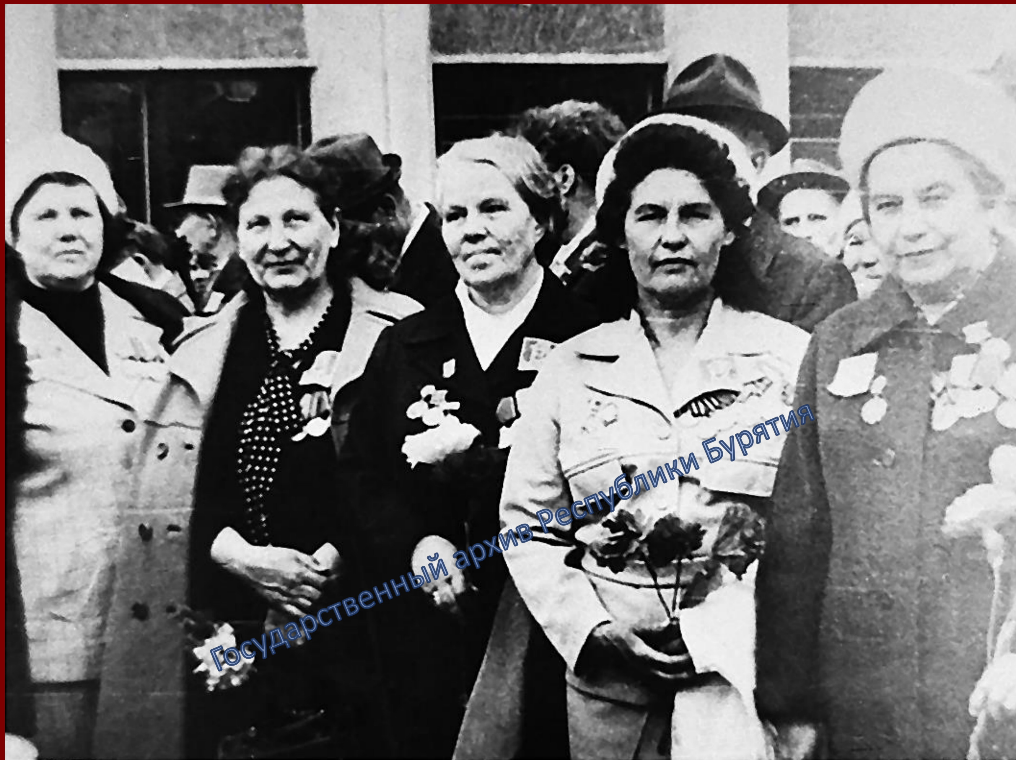
Женщины - ветераны Великой Отечественной войны. г. Улан-Удэ, 09 мая 1985 г.