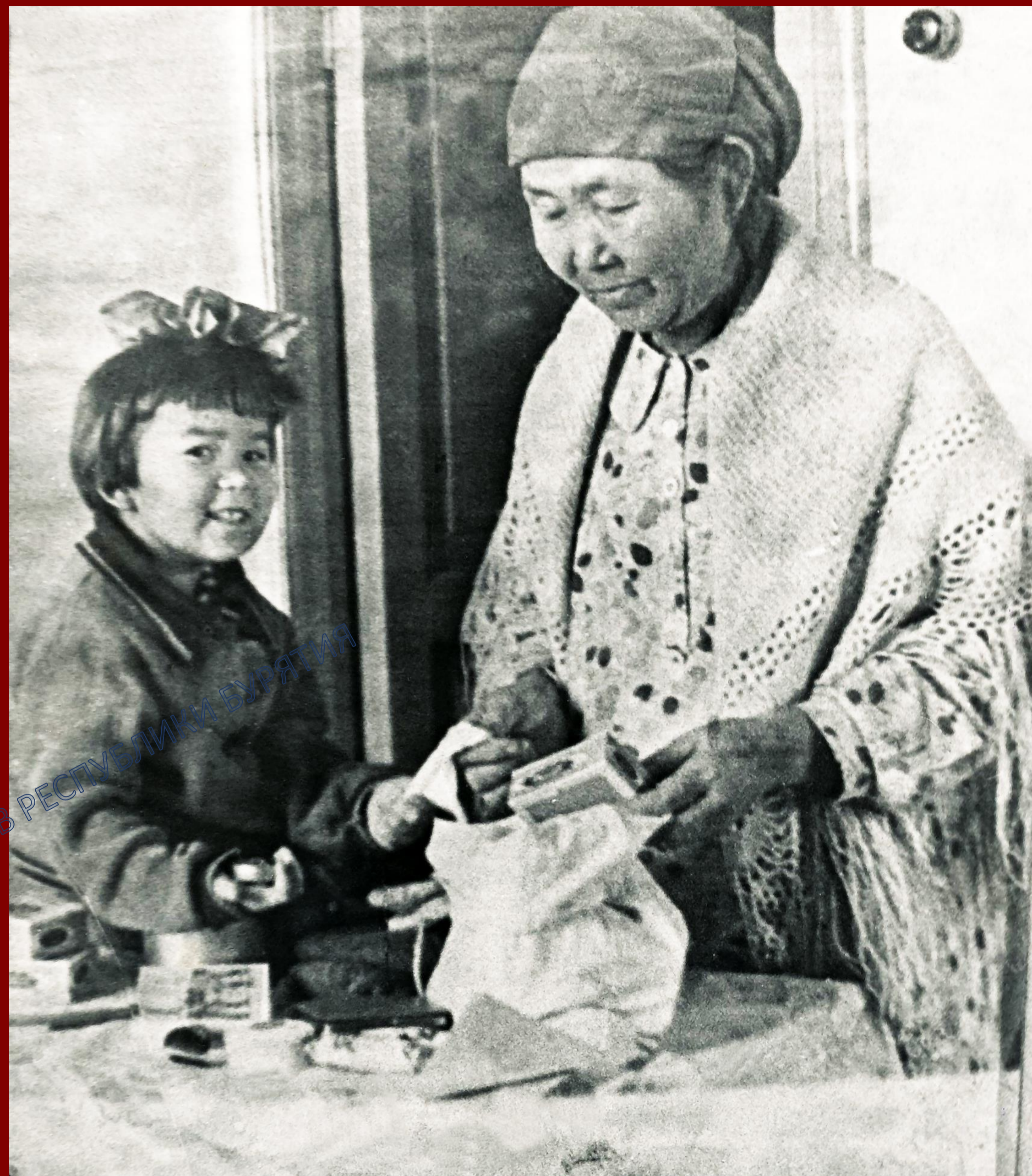
Сводная ведомость подарков, отправленных трудящимися республики, бойцам действующей Красной армии. 07 января 1942 г. ГАРБ. ФП.1. Оп.1. Д.4011. Л.45