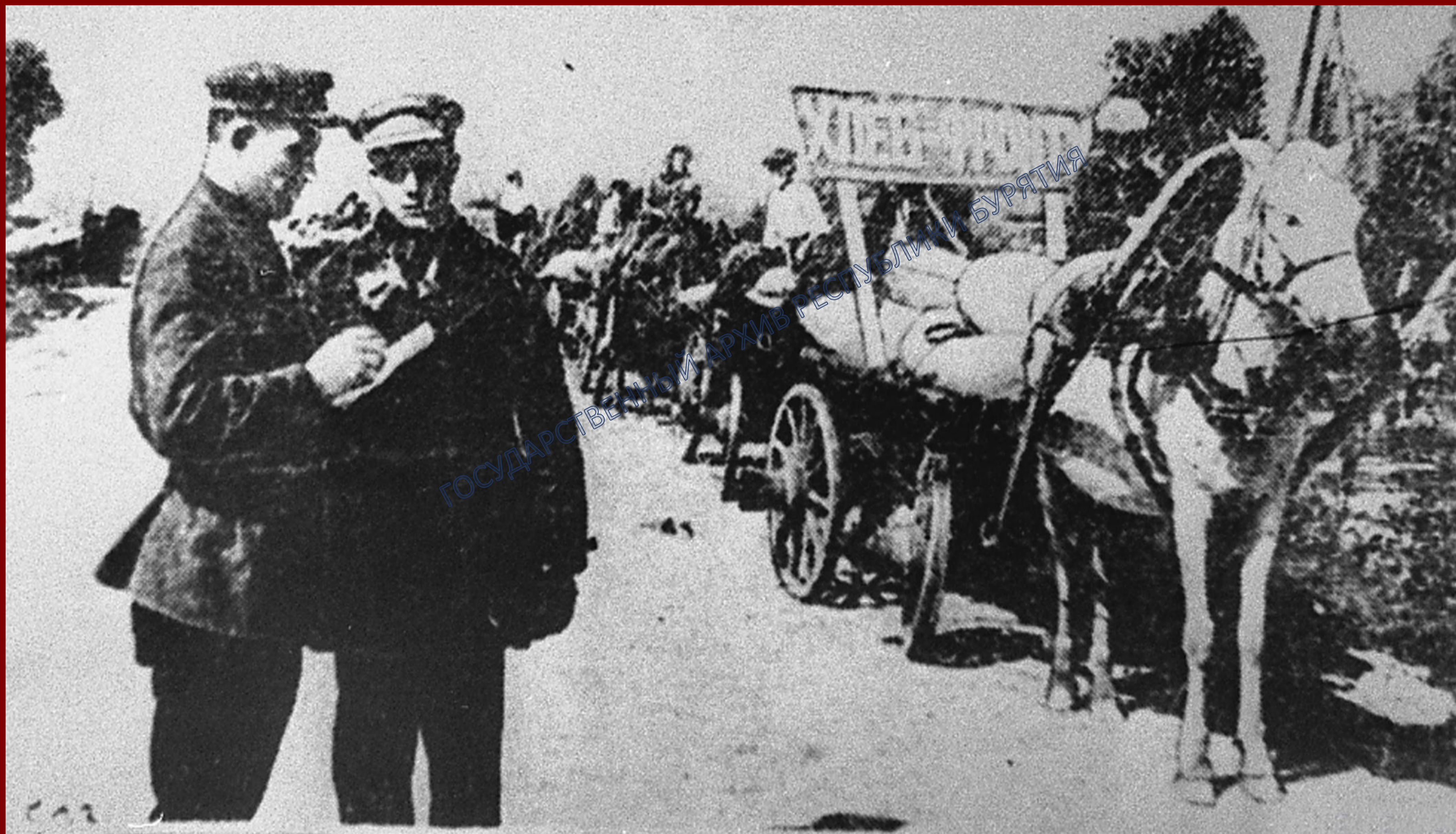
Хлеб фронту от трудящихся Бурят-Монголии. 1942-1943 г.