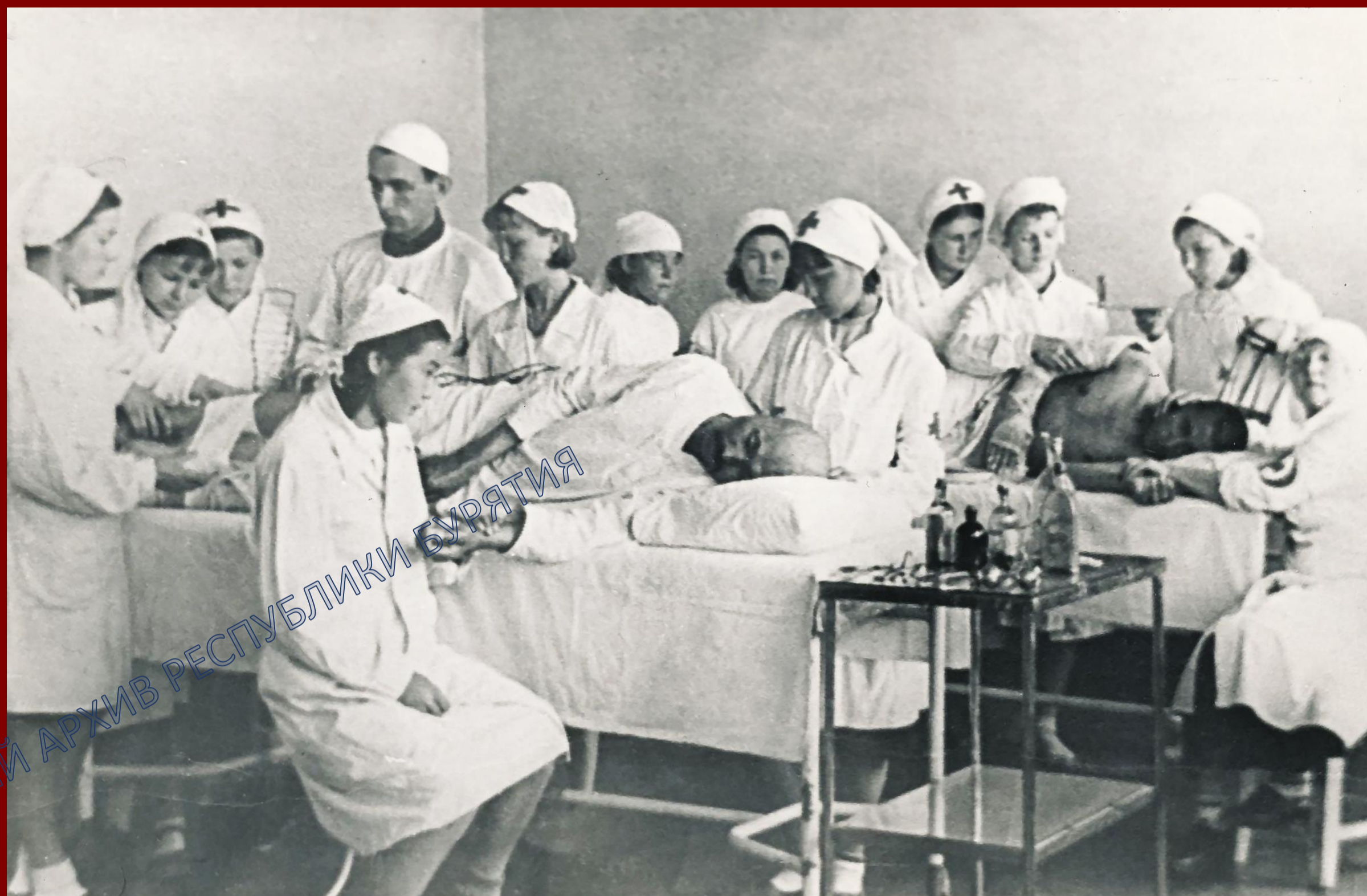
Перевязочная госпиталя в годы войны. г. Улан-Удэ. 1942 г.

Всего с момента организации до мая 1945 г. в эвакогоспитали Бурятии поступило 30 968 раненых и больных, нуждающихся в сложной хирургической помощи и протезировании.