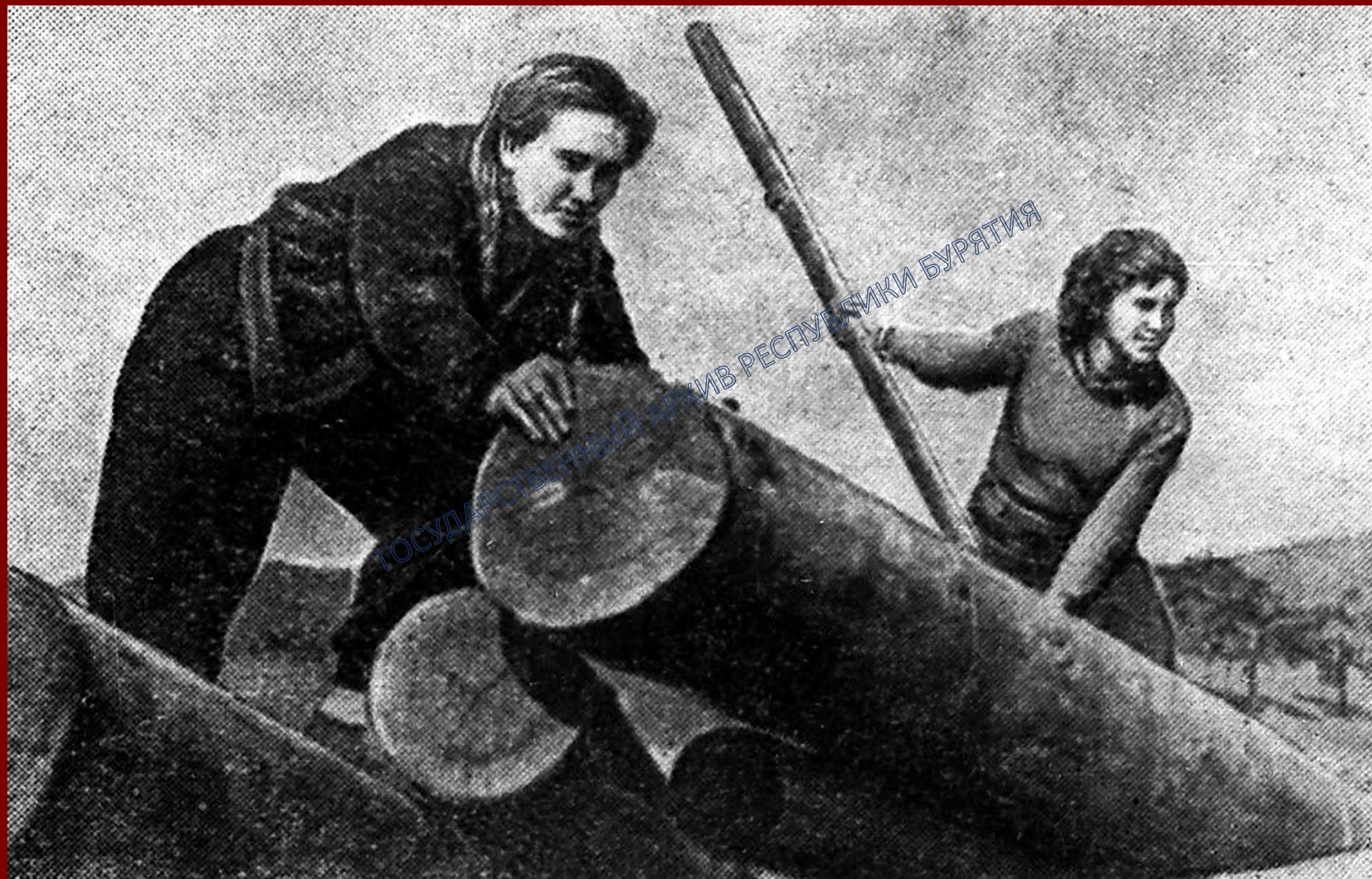
Воскресник - всенародная помощь фронту. 1941 г.