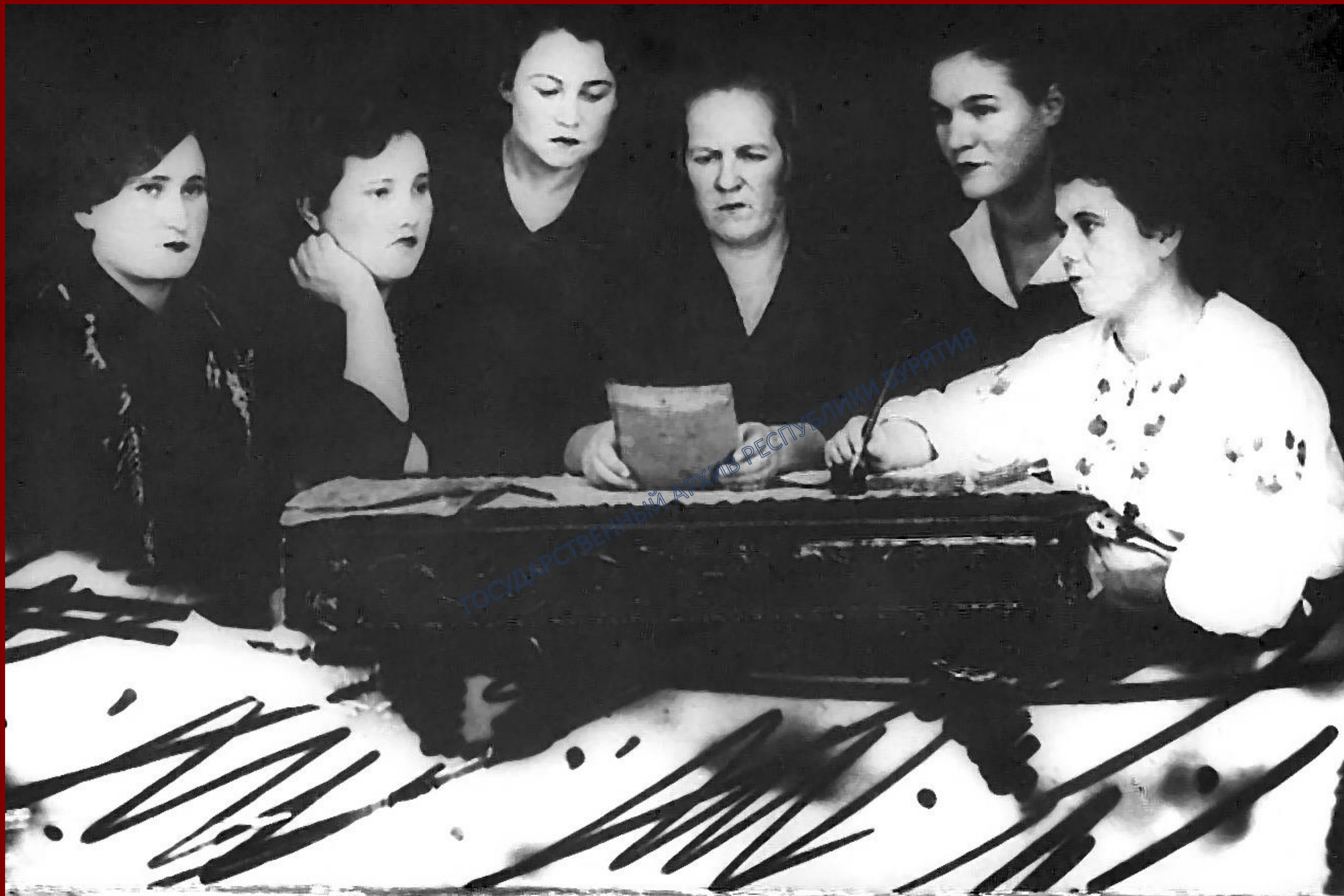
Первые женщины-машинистки паровозов депо г. Улан-Удэ. 1942 г.