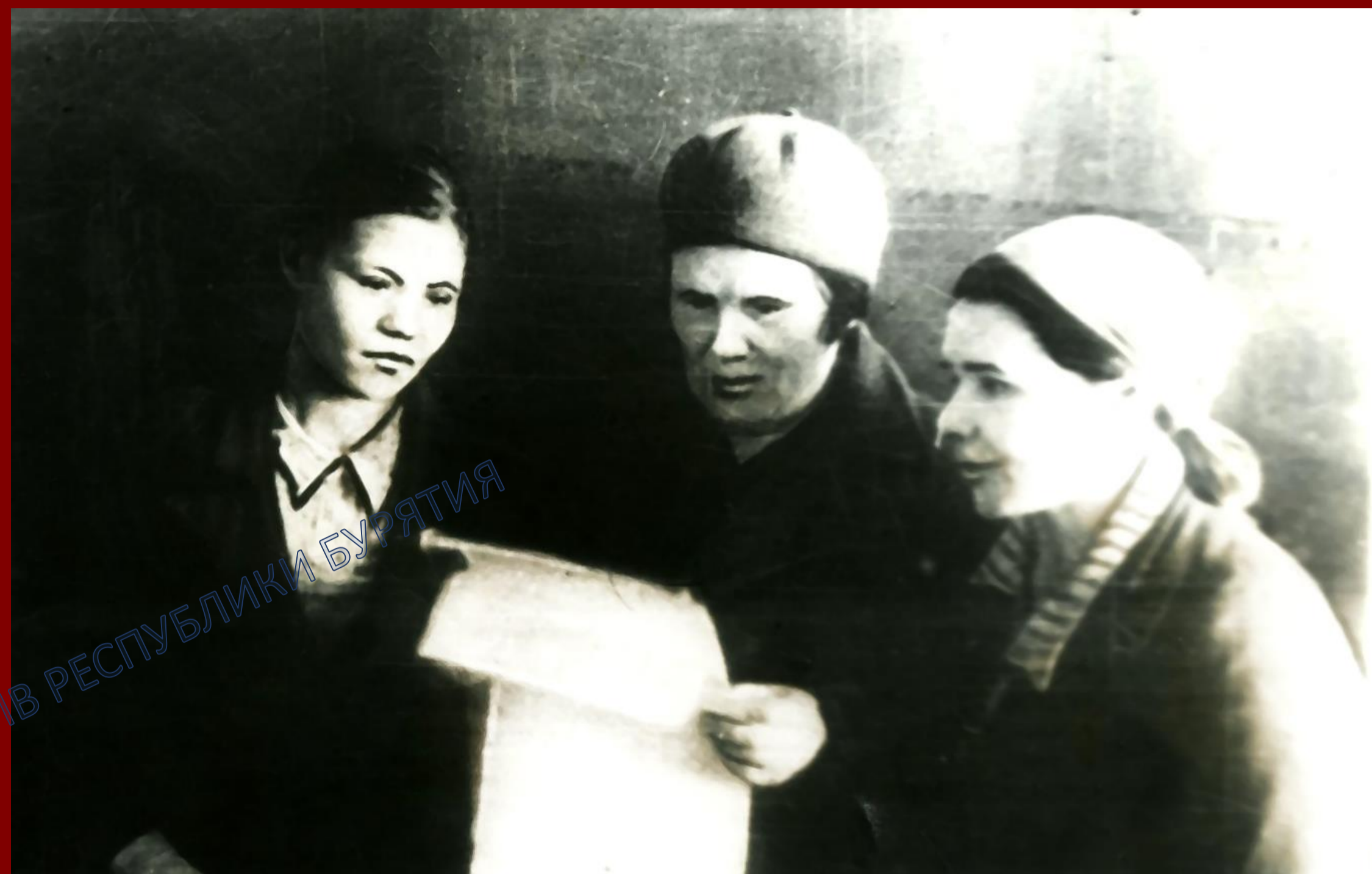
Организация сбора теплых вещей населением г. Улан-Удэ.