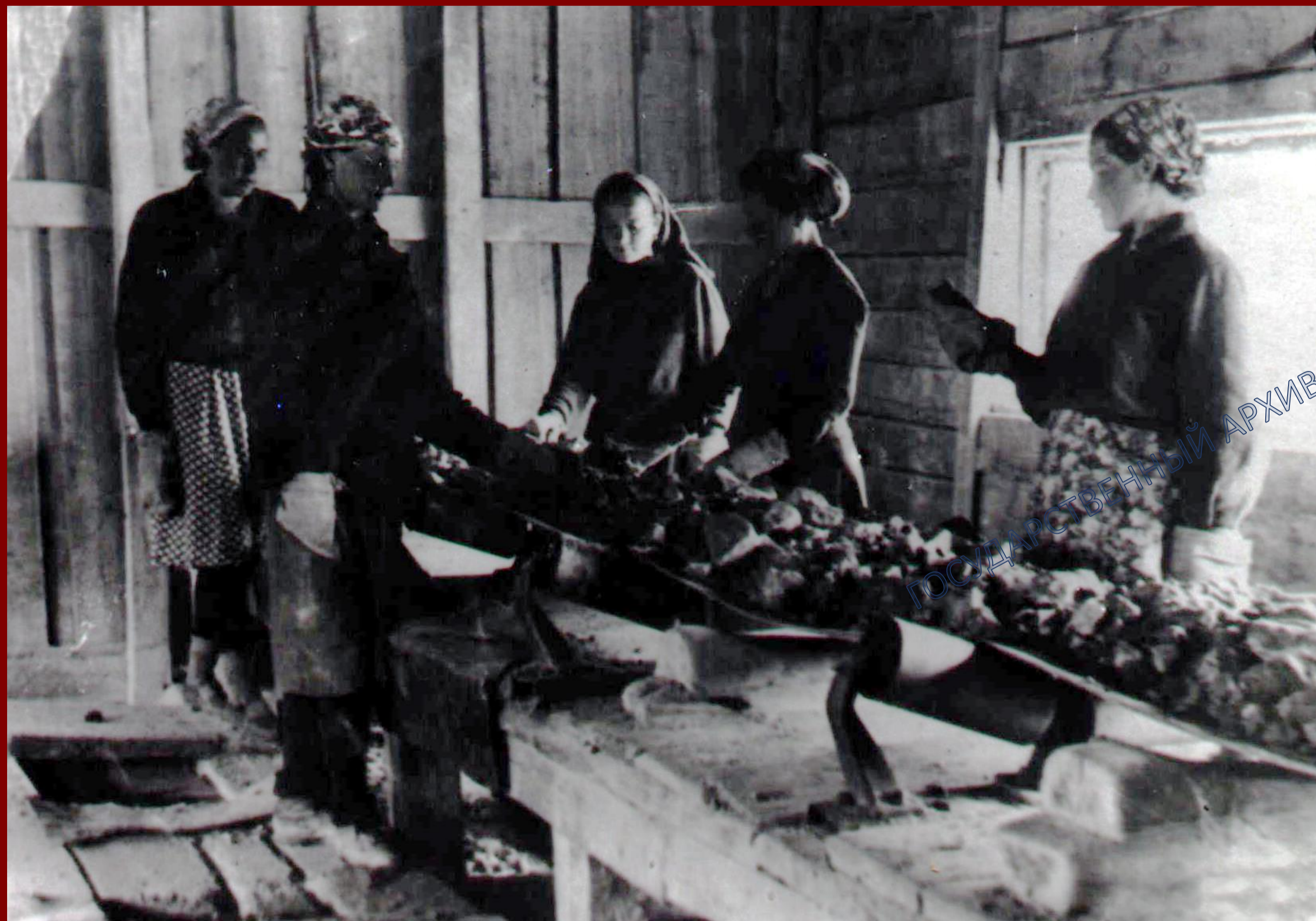
Джидаккомбинат в годы Великой Отечественной войны. Без даты.

Джидинский вольфрамово-молибденовый комбинат в годы войны являлся главным поставщиком молибдена промышленным предприятиям СССР. В броне каждого третьего танка, выпущенного в 1941-1945 гг., был вольфрам с Джидинского комбината.