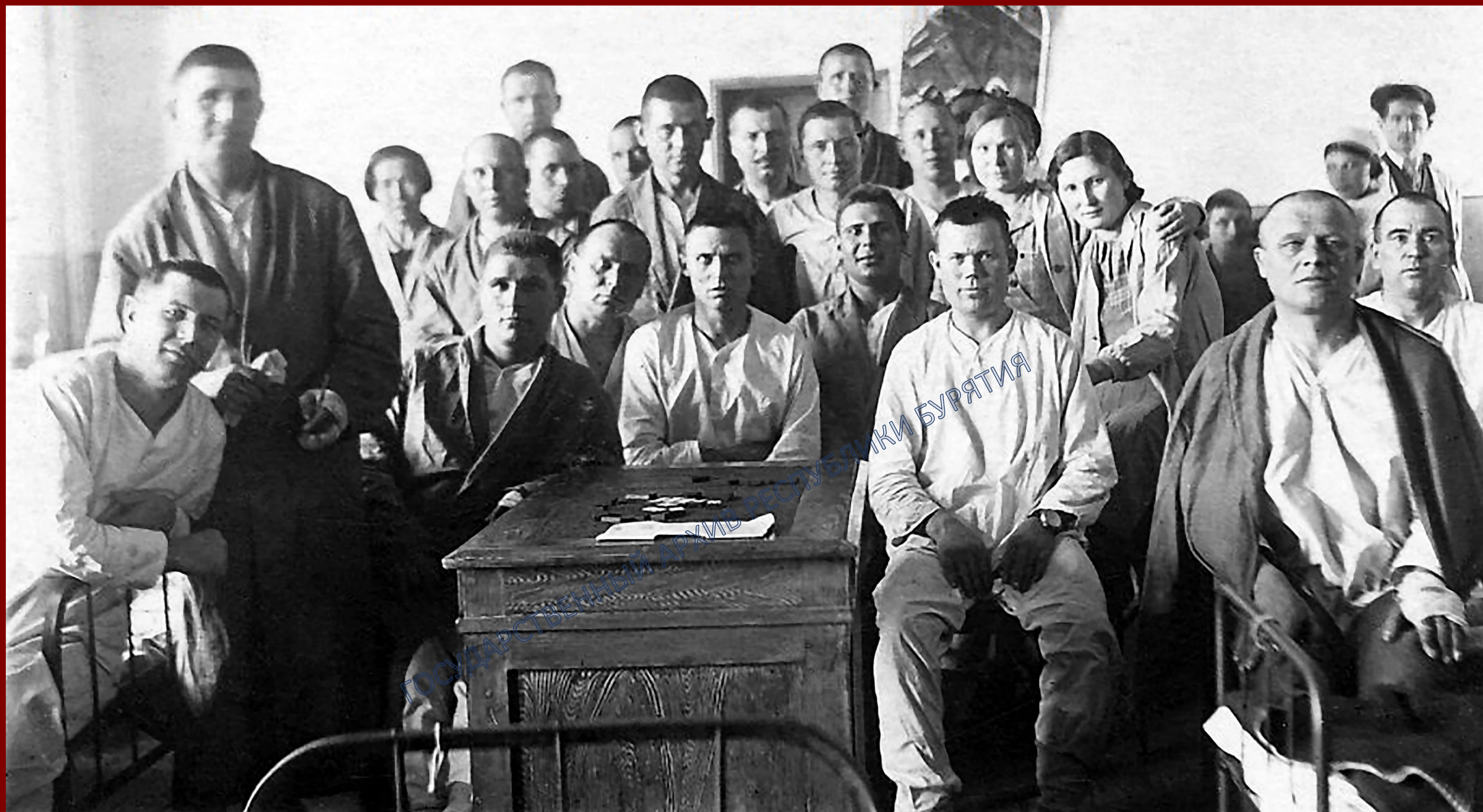
Подшефная палата № 17 Улан-Удэнского госпиталя с сотрудниками Центрального государственного архива. г. Улан-Удэ. 1942 г.