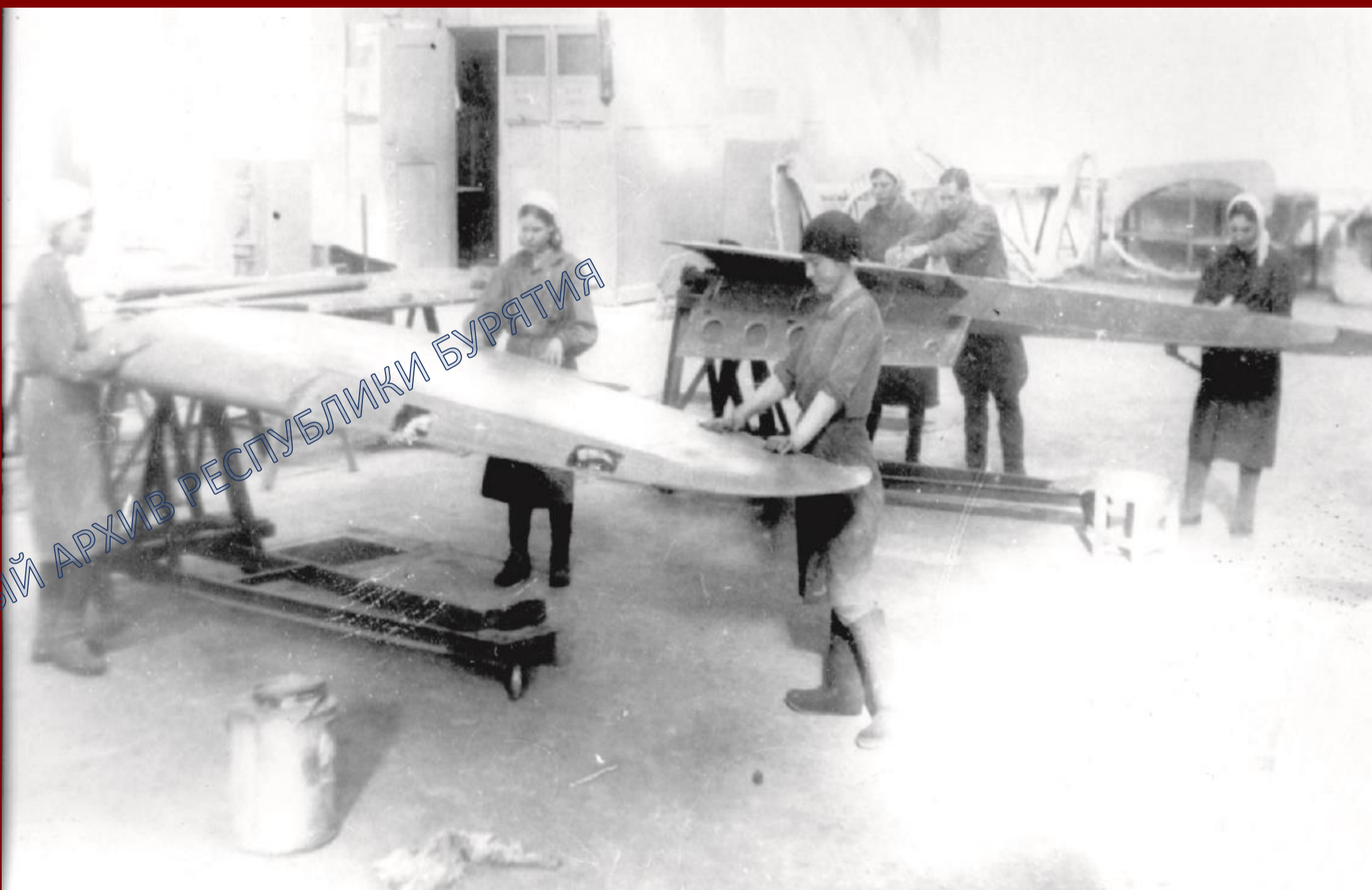
В цехе Улан-Удэнского авиационного завода. 1943 г.

Улан-Удэнский авиазавод ремонтировал истребители И-4, И-153 (БИС) «Чайка», И-16, авиационные моторы М-23, М-73 и М-100. С февраля 1943 г. завод стал выпускать самолет Ла-5, который отлично проявил себя в ходе битвы за Сталинград и сражения на Курской дуге. До июня 1944 г. заводчане передали на фронт 283 боевые машины.