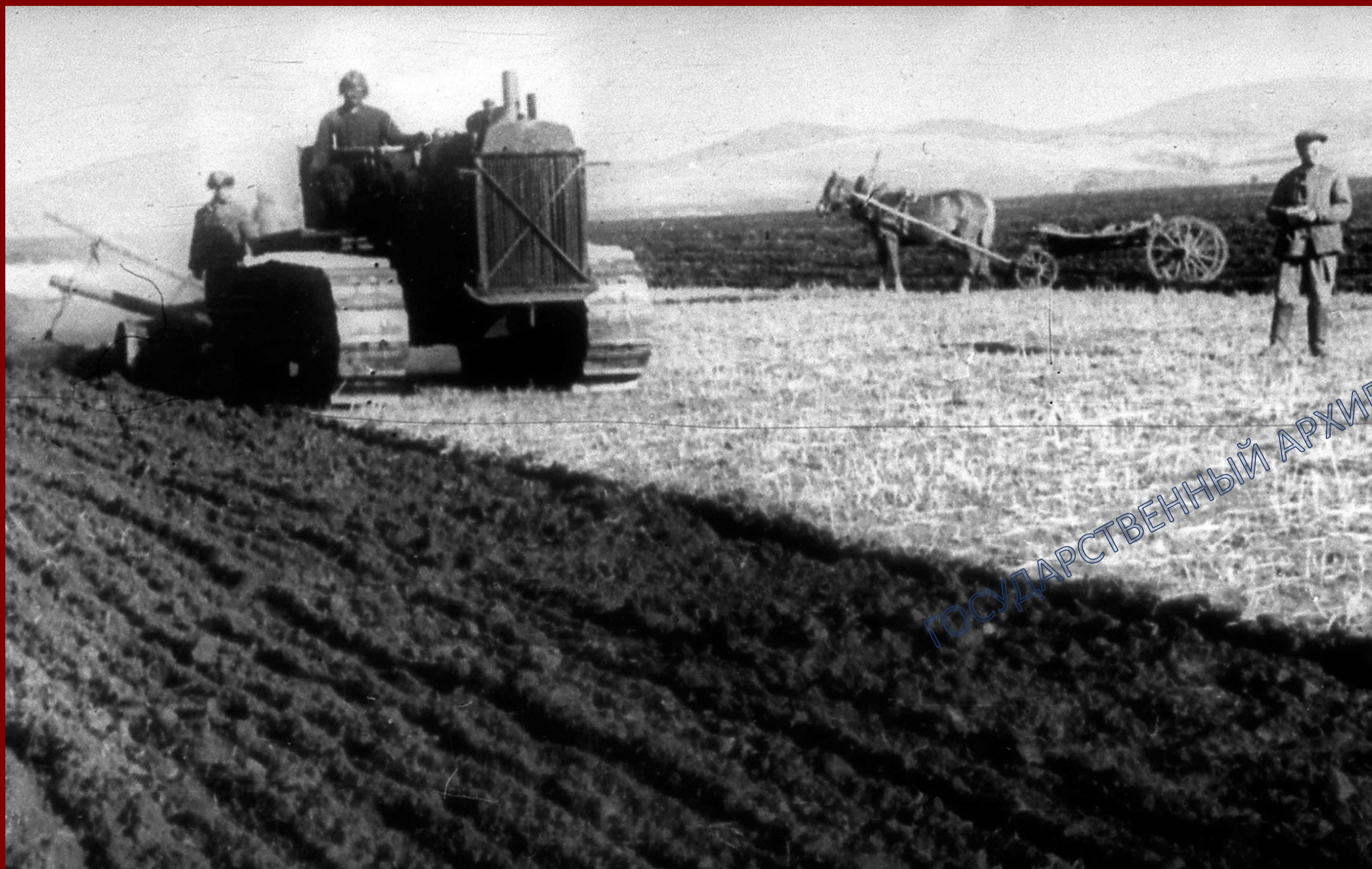
Женщины-трактористки на пахоте. 1943 г.

ГАРБ. Бурят-Монгольская правда. 11 июля 1941 г., № 161. С.3