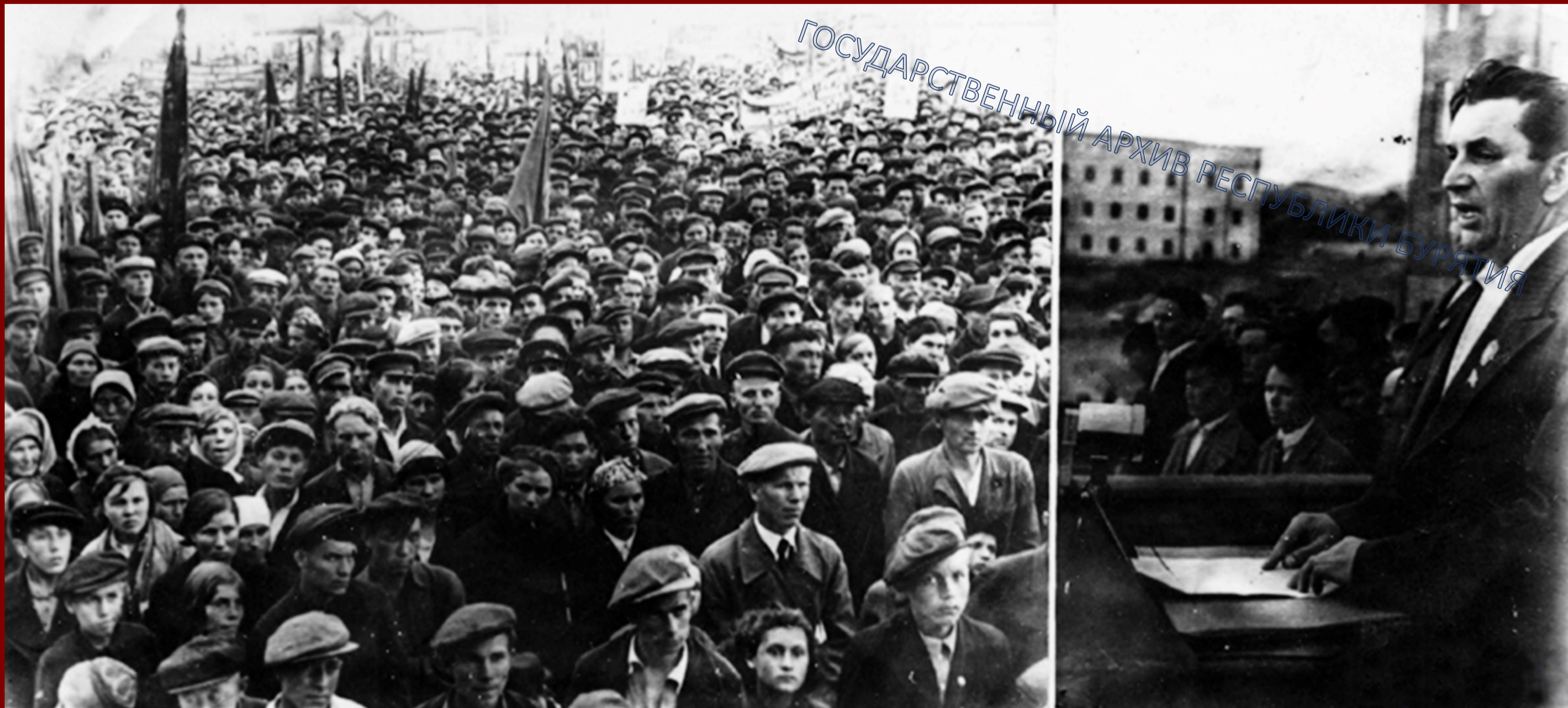
Митинг трудящихся г. Улан-Удэ. Выступает секретарь Бурят-Монгольского обкома ВКП(б) С.Д. Игнатьев.

В годы Великой Отечественной войны на территории Бурятии было размещено 14 эвакуогоспиталей. Благодаря усилиям врачей большое количество военнослужащих выздоравливали и возвращались на фронт.