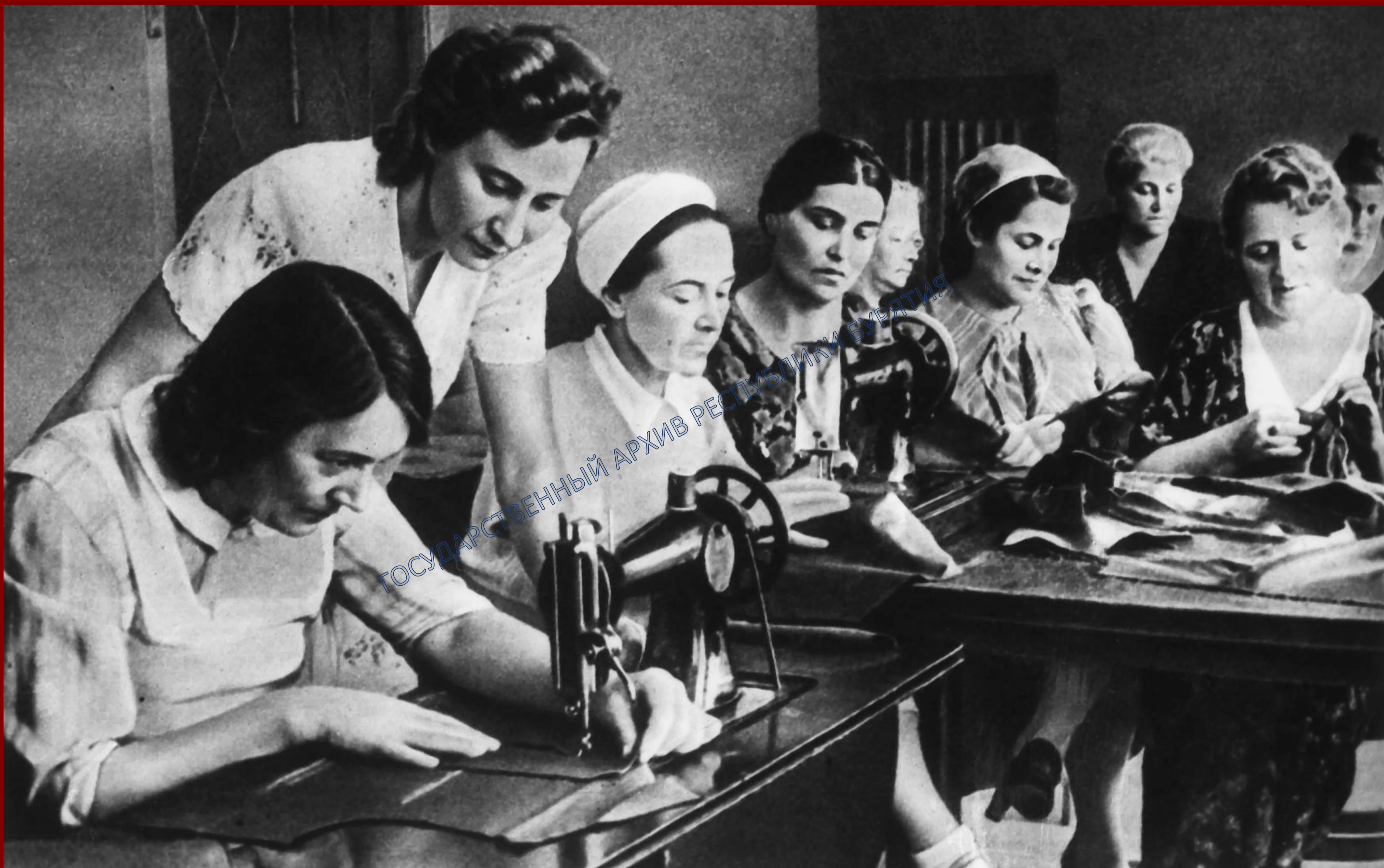
Домохозяйки г. Улан-Удэ шьют воинское обмундирование для воинов Красной армии. 1941 г. ГАРБ. ФР.1971. Оп.1. Д.116. № 7

С начала Великой Отечественной войны на предприятия и учреждения Центрального района пришло 1300 женщин, 98 домохозяек работают на дому по выполнению специальных заданий для Рабоче-Крестьянской Красной армии по пошивке и починке белья, обмундирования.