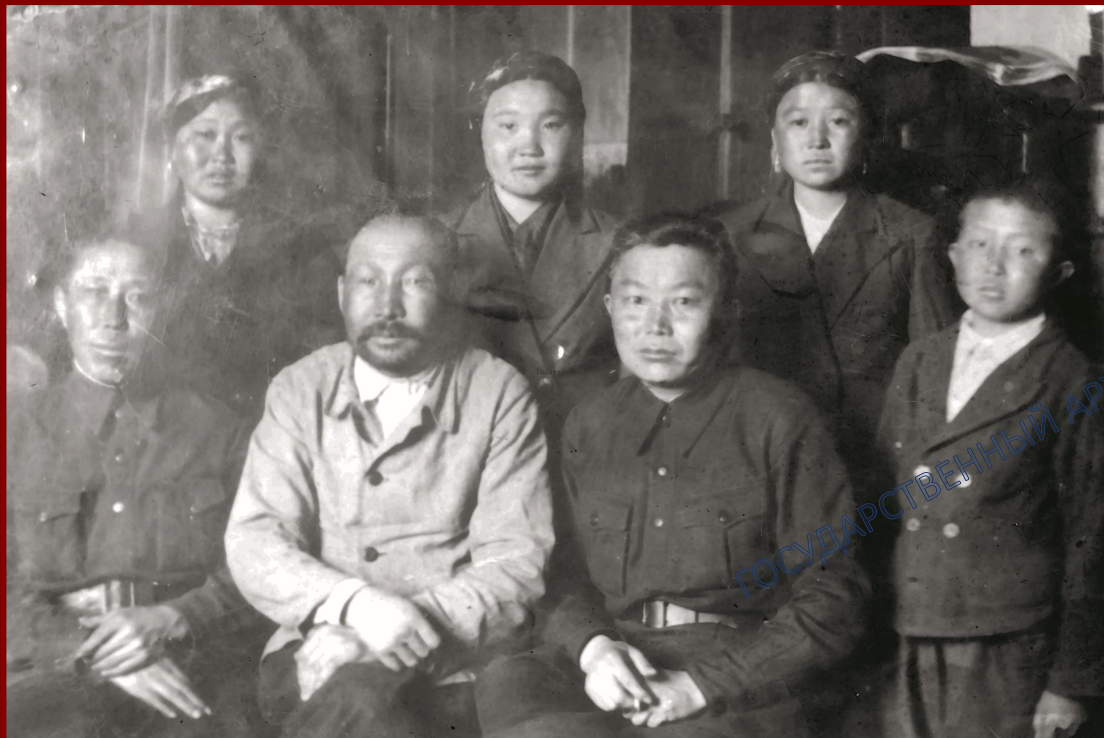
Колхозники Селенгинского аймака, построившие военный самолет на свои средства. 1944 г.

Патриотизм народа Бурятии нашел свое яркое выражение в активном создании трудящимися республики мощного народного Фонда обороны страны. Всего за годы войны граждане внесли около 100 млн. руб. деньгами и 60 млн. руб. облигациями, отправили на фронт более 322 тыс. теплых вещей.