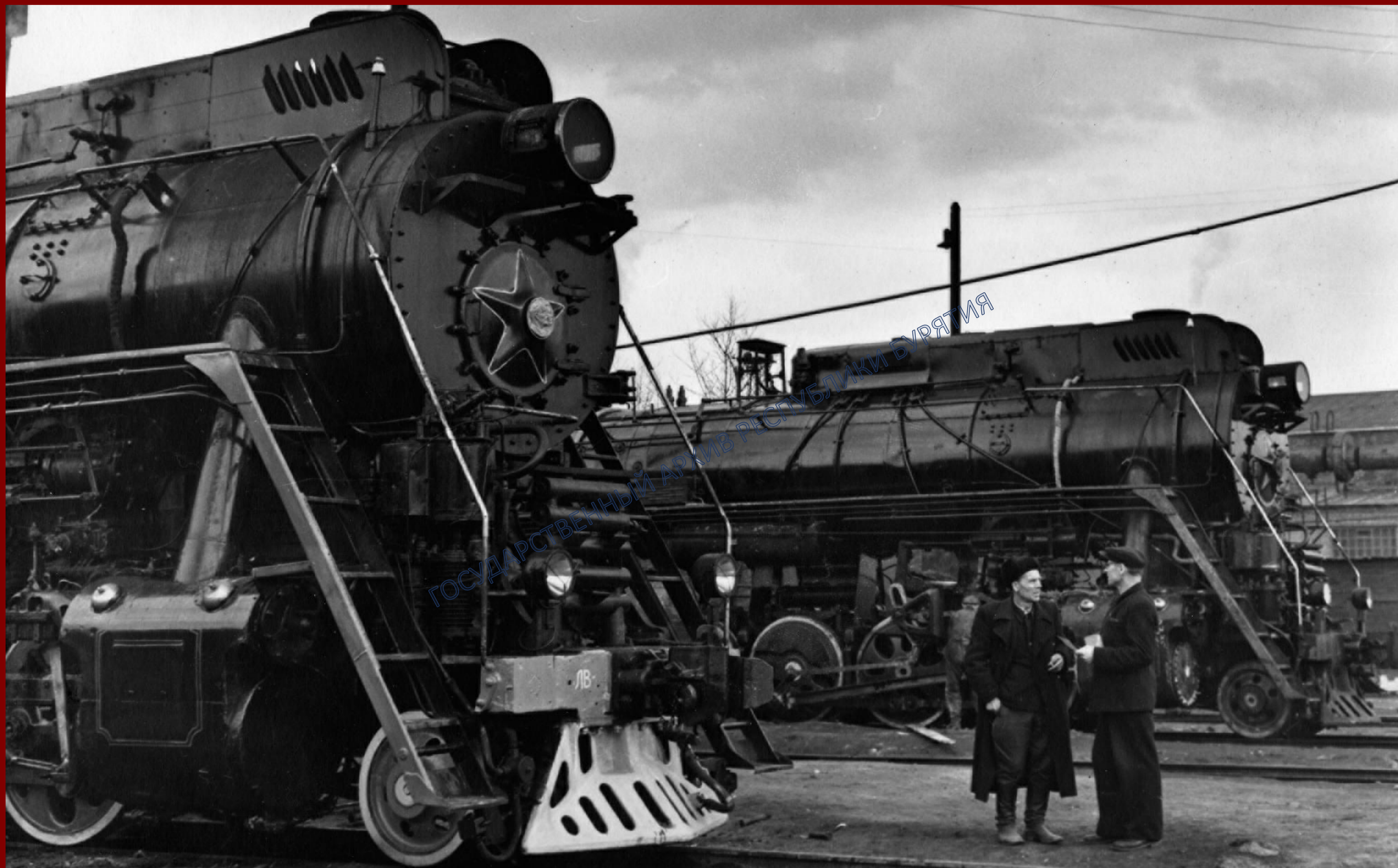
Паровозы после ремонта на Улан-Удэнском ПВЗ готовы в путь. 1944 г.

За самоотверженный труд в годы войны 6228 тружеников паровозо-вагонного завода отмечены правительственными наградами, в том числе 6200 человек награждены медалью «За доблестный труд в Великой Отечественной войне».