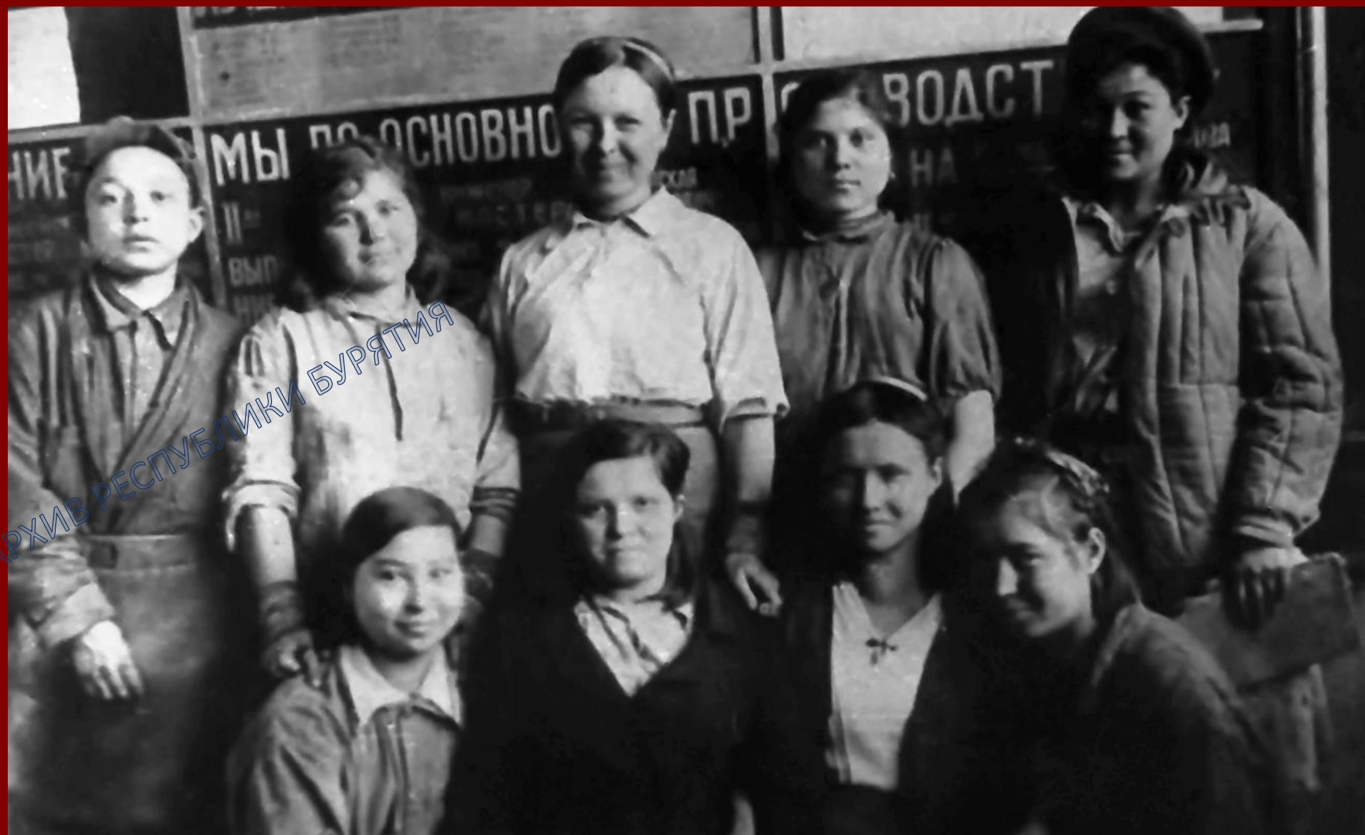
Лучшая комсомольско-молодежная бригада Улан-Удэнского механизированного стекольного завода. 1945 г.

22 декабря 1943 г. по итогам работы за ноябрь Улан-Удэнский мехстеклозавод был признан победителем Всесоюзного социалистического соревнования. В январе 1944 г. коллектив завода выполнил план на 111%, ему было присуждено переходящее Красное знамя ВЦСПС и Наркомата стройматериалов.