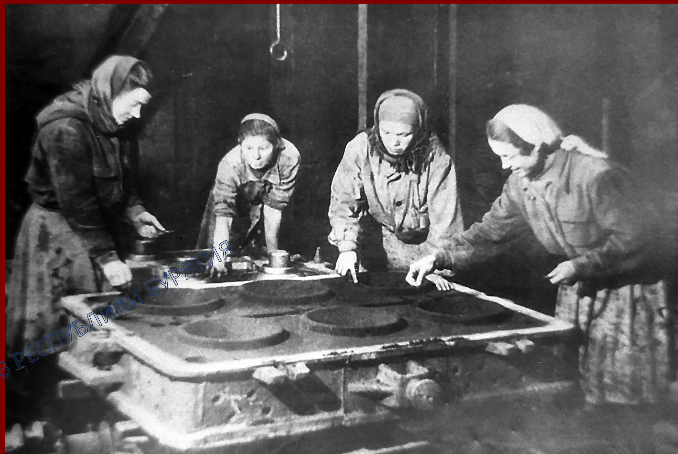
Формовщицы чугунолитейного цеха Улан-Удэнского ПВЗ выполняют фронтовой заказ. 1942 г.

За 1941–1945 гг. были возвращены в строй 271 паровоз и 1242 грузовых вагона, пострадавших от бомб и снарядов. На паровозо-вагонном заводе в начале войны около 700 рабочих давали по две нормы, а 350 человек давали от трех до шести норм.